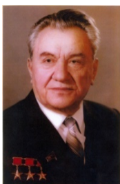
Д.Қонаев мемлекет қайраткері

«Кенен Әзірбаев – өмірде де, өнерде де қайталана бермейтін ерекше құбылыс».