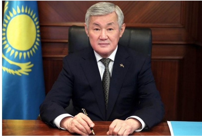
Бердібек САПАРБАЕВ, Жамбыл облысының әкімі