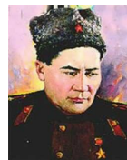
Б.Момышұлы халық қаһарманы